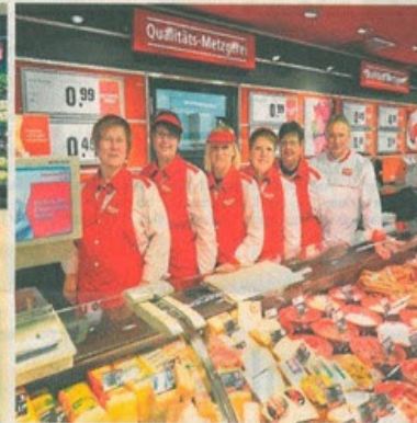
Die haus eigene Metzgerei steht für hohe Qualität der Fleisch- und Wurstwaren.