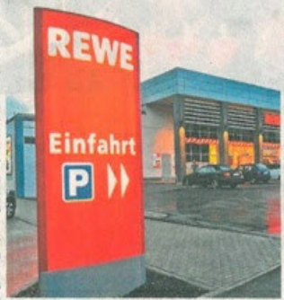
Zahlreiche Parkplätze stehen kostenlos zur Verfügung.