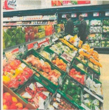
Auf Frische wird besonders großer Wert gelegt.

... einkaufen montags bis samstags von 6-22 Uhr