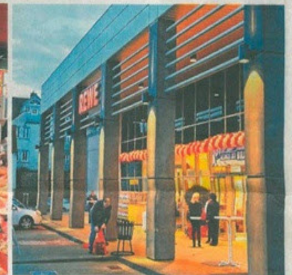
Die offene Gestaltung des Neubaus lädt zum Einkaufen ein.