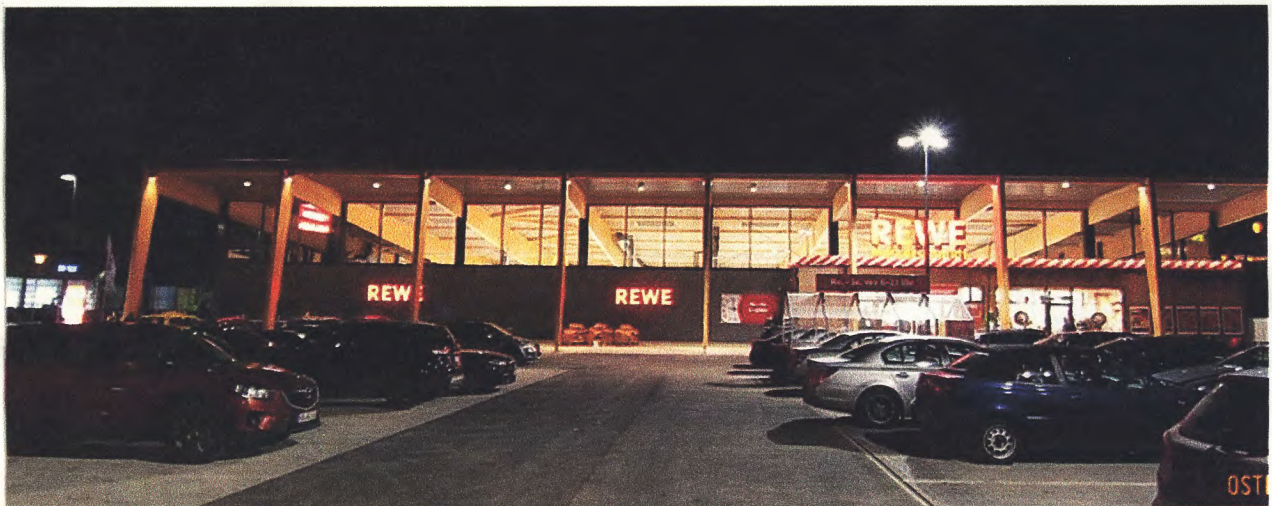
Die Silhouette des Marktes in Kirchheim. ...