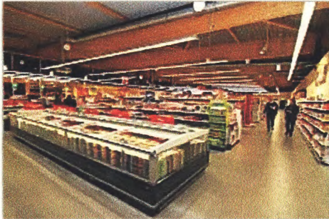
Großzügige Verkaufsflächen im neuen Kirchheimer Rewe-Markt. ...