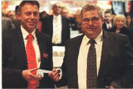
Der Schlüssel zum neuen Markt: Bernd ...