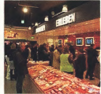
Herz des neuen Marktes: Die Fl

28.11.13 - KIRCHHEIM - Die Silhouette allein ist imposant: Eine riesige Glasfront, gestützt von Holzpfählern bietet für einen der modernsten Supermärkte in Deutschland. In Kirchheim - am Knotenpunkt der Autobahnen A 4, A 5 Rewe am Mittwochabend gemeinsam mit über 200 Ehrengästen seinen neuen Supermarkt eröffnet. Er ersetzt den, welcher in die Jahre gekommen und einfach zu klein war. Nunmehr finden rund 25.000 Artikel auf 1.500 Quadratmetern Fläche. Eine hochmoderne Wurst- und Fleischtheke mit einem Café und über 120 Parkplätze gehören zum neuen Angebot. Das Vorbild für den Kirchheimer Markt stammt von der Bundeshauptstadt. Das REWE Green Building setzt auf einen nachhaltigen Bau und Betrieb von Handelsinseln und wurde erstmals in Berlin als Pilotprojekt umgesetzt.