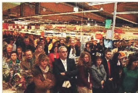
Über 200 Gäste kamen zur Vorab-Eröffnung ...