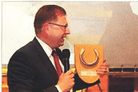
Ein Glückseisen für den neuen Markt, ...